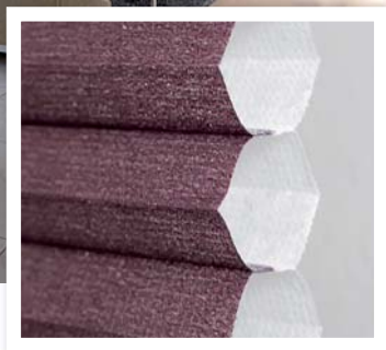
Plisy podwójne Duoplisso

Plisy stanowią bardzo praktyczny, a zarazem estetyczny element aranżacji. Świetnie chronią przed nagraniem pomieszczenia na poddaszach. Plisy polecane są między innymi do mieszkań znajdujących się np. na parterze, ponieważ z łatwością pozwalają osłonić okno od dołu do góry chroniąc wnętrze mieszkania przed niepożądanym wzrokiem z zewnątrz. Jest to ważny aspekt odróżniający plisy od żaluzji czy rolet. Poza tym możliwością jest więcej - zasłonięcie tylko środkowej lub innej wybranej części szyby, a w przypadku kilku okien sąsiadujących ze sobą stworzenie własnej kompozycji.