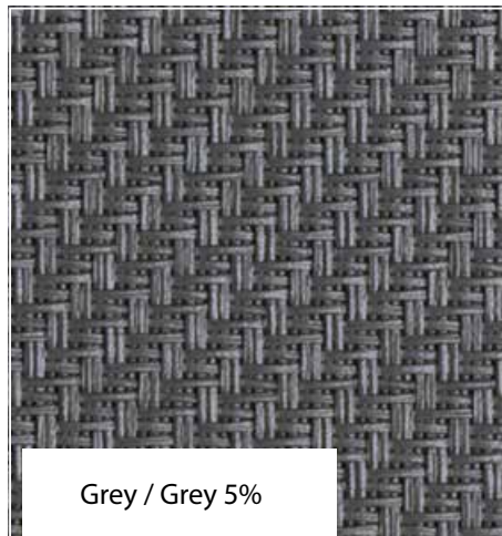
Grey / Grey 5%