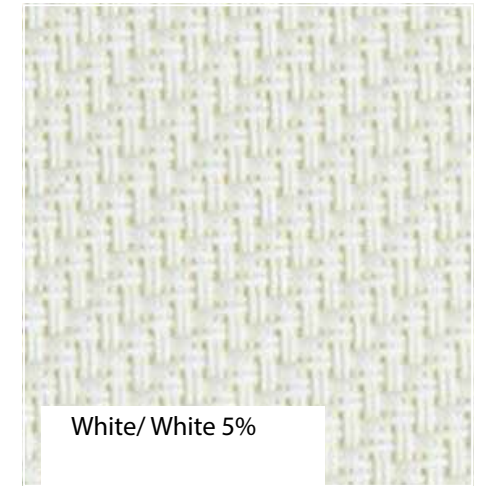
White/ White 5%

Prezentowane kolory i wzory mają charakter poglądowy i w zależności od monitora będą różnie wyświetlane. W celu wybrania odpowiedniego koloru należy posłużyć się oryginalnym wzornikiem Vertex S.A.