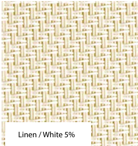
Linen / White 5%